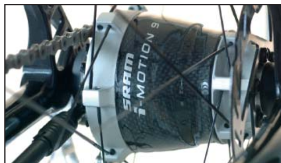
Die Getriebe-nabe des 21. Jahrhunderts

Natürlich besitzt das Konzeptfahrrad auch die bisherigen i-MOTION 9 Vorteile: Eine große Gesamtübersetzung, gleichmäßige Gangabstufung, Schalten im Stand und Schalten unter Last - alles geschützt im System einer Getriebe-nabe