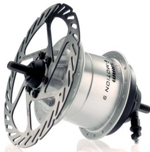
i-MOTION 9 Scheibenbremse