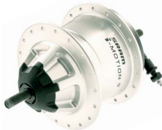
i-MOTION 9 Freilaufnabe

i-MOTION 9 ist neben der Freilaufvariante und Scheibenbremsen-Version auch mit Rücktrittbremse und als i-BRAKE Bremssystem erhältlich.