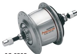
SG-8R25 Premium-Version für Rollenbremse